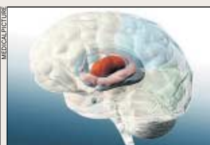
Thalamus (rot): Taktgeber des Gehirns.

Bei Hirnfunktionsstörungen – Epilepsie, Nervenschmerzen, Parkinson, Tinnitus – sind die Rhythmen zwischen verschiedenen Hirnarealen gestört. Insbesondere derjenige zwischen Thalamus und Hirnrinde. Schätzungsweise 15 000 bis 20 000 Menschen leiden in der Schweiz an einer solchen Disrhythmie. Sind bestimmte Zellareale im Thalamus defekt, kippen diese in eine langsamere Rhythmizität. Die Arealen der Hirnrinde parieren und verlangsamen ihren Rhyth-