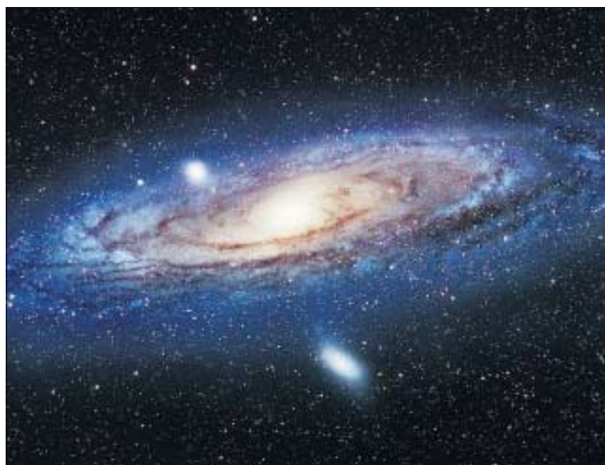
Andromeda-Galaxie: Mehr als zwei Millionen Lichtjahre entfernt.

Tatsächlich wurde auf diese Weise schon eine ganze Reihe von Planeten in unserem Sonnensystem entdeckt. «Der Gravitationslinseneffekt hat gegenüber anderen Beobachtungsmethoden den Vorteil, dass er Planeten in sehr grosser Entfernung nachweisen kann», sagt Jetzer. «Sogar relativ kleine Plane-