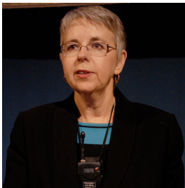
pädiatrische Gynäkologin, San Diego USA

referierte zum Thema: „Evaluation of suspected child sexual abuse“. Sie ist die Schöpferin der weltweit benutzten Adams Kriterien, einem Klassifikationsschema zur Beurteilung der anogenitalen Befunde (deutsche Version in www.kindsmisshandlung.de ). In ihrem Referat zeigte sie auf, dass für die Befunderhebung im Genitalbereich eine entsprechende Erfahrung unabdingbar ist (gute Kenntnisse der Anatomie, Normvarianten und Pathologien). Des weiteren spielt die emotionale Führung und Beziehung zum Kind und zur Begleitperson eine äusserst wichtige Rolle. Der nicht traumatisierende und psychisch möglichst nicht belastende Untersuchungsablauf (die Untersuchung darf nie erzwungen werden) ist oft der erste Schritt zum Heilungsprozess: Es soll dem Kind versichert werden, dass es „okay“ resp. gesund ist, und eventuelle Verletzungen rasch abheilen; Verletzungen sollten insbeson-