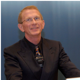
Pädiater und seit 21 Jahren Leiter der Kinderschutzgruppe am Kinderspital Zürich

stellte die aktuelle Aufarbeitung der Zahlen 2003 - 2006 (1484 Fälle) vor: Mit rund 400 Fällen pro Jahr allein am Kinderspital Zürich ist Kindsmisshandlung nach wie vor ein häufiges Phänomen. Am häufigsten werden sexuelle Übergriffe gemeldet, gefolgt von körperlicher und psychischer Misshandlung. Bei allen Misshandlungsformen ausser der sexuellen Ausbeutung sind Eltern die häufigsten Verursacher.