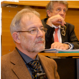
lic. iur., Spezialist für Vormundschaftsrecht

legte in seinem Beitrag „Kindesschutz in der Schweiz – Entwicklung – Stand – Perspektiven“ dar, wie sich der Kindesschutz in den letzten 100 Jahren zunehmend im Zivilgesetzbuch abgebildet hat. Das Zivilrecht bietet, parallel zur strafrechtlichen Verfolgung der Täter, zahlreiche Möglichkeiten, Kinder zu schützen und auch präventive Massnahmen einzuleiten, wenn von einer Gefährdung ausgegangen werden muss. Allerdings gibt es noch Verbesserungsmöglichkeiten bei der Verteilung und Klärung von Kompetenzen und beim Aufbau klarer strukturierter Behörden, sowohl inner- als auch interkantonal. Eine wesentliche Verbesserung wird hier hoffentlich die Totalrevision des Vormundschaftsrechts bringen, welche voraussichtlich 2013 in Kraft treten wird.