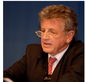
Leitender Oberstaatsanwalt des Kantons Zürich

beschrieb in seinem Vortrag: „Die Gerechtigkeit eine besoffene Zwiebel?“ die juristischen Meilensteine des Kinderschutzes in den letzten 2 Jahrzehnten: Das Opferhilfegesetz aus dem Jahr 1993 ist das Fundament. Dann berichtete er über die Fallstricke und Unzulänglichkeiten der Strafverfahren für die kindlichen Opfer. Er wünschte sich, dass Kinder auch in der Schweiz – wie bereits in den Nachbarländern gesetzlich verankert – vor Körperstrafen geschützt sind und er machte sich stark für eine Fachstelle für Kinderschutz und Kinderrechte.