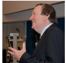
Neurologe und international anerkannter Spezialist für Schüttertrauma in Edinburgh, Schottland

referierte in seinem Vortrag „Recent Developments in Non Accidental Head Injuries“ über neue Erkenntnisse in der Auswertung von Untersuchungsbefunden beim Schüttertrauma.