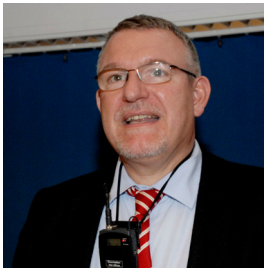
Kinder- und Jugendpsychiater aus Ulm

schilderte in seinem Vortrag die Entwicklung des sehr aktiven Bereichs „Frühe Hilfen – Prävention von Kindesvernachlässigung und Kindesmisshandlung“ in Deutschland. Die Inzidenz an kinderpsychiatrischen Störungen liegt nach neueren Forschungsergebnissen bereits bei den unter 3-jährigen bei bis zu 20%. Einige dramatische Fälle von tödlich endenden Kindesmisshandlungen haben in den letzten Jahren die deutsche Bevölkerung und Politiker aufgerüttelt. Man geht davon aus, dass 5-10% aller in Deutschland lebenden Kinder von Vernachlässigung betroffen sind, mit verheerenden Auswirkungen auf ihre Entwicklung. In diesem Zusammenhang kommt die längst bekannte entwicklungspsychologische Erkenntnis zum Tragen, dass fördernde Massnahmen eine umso höhere Effizienz haben, je früher sie ansetzen. Dies auch vor dem Hintergrund einer Kosten-Nutzen-Abwägung.