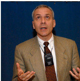
Soziologe aus Montreal

berichtete in seinem Beitrag „The Epidemiology of Child Maltreatment“ über neue Methoden zur Erfassung von Kinderschutzfällen in Kanada. Dort sterben jedes Jahr 1500 Kinder (2.2 pro 100'000 Einwohner) durch Gewaltdelikte und 900'000 Kinder (12 pro 1000 Einwohner) werden nachweislich pro Jahr misshandelt. Logische Konsequenz aus den Forschungsergebnissen über Risikofaktoren ist die Forderung nach mehr primärer und sekundärer Prävention durch Interventionen in der frühesten Kindheit.