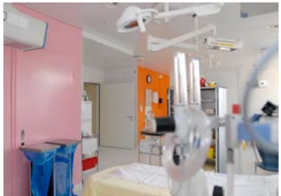
Nach Abschluss der ersten Etappen zeigen sich die modern gestalteten Räumlichkeiten von Labor, IMC und Schockraum in frischen und freundlichen Farben.