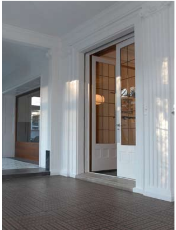
Die mit viel Geschmack eingerichteten Räume am Bungertweg stehen für verschiedenste Anlässe zur Verfügung.