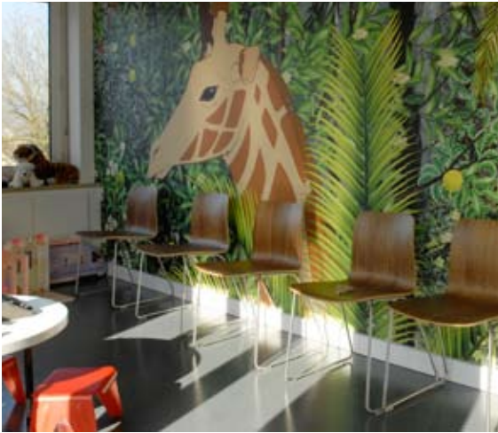
Die Fototapeten zeigen Motive des Films «Kirikou und die wilden Tiere». Sie wurden für die Warteräume im Geschoss C erstellt.