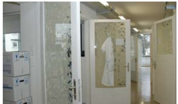
Neu gestaltet im Oberen Haus 1: Büros für die Ärzteschaft.

Um den Mangel an Büros, Sitzungszimmern und Garderoben zu verringern, aber auch um die Behandlungsbereiche Operationstrakt, Bettenhaus und Poliklinik zu entlasten und die dringend benötigten Räume für Patientinnen, Patienten, deren Eltern und dem Personal zur Verfügung zu stellen, wurden die seit längerem leer stehenden Räume der Oberen Häuser 1 und 2 instand gestellt. Für die Finanzierung gewährte der Regierungsrat in einer ersten Tranche im Mai 2007 einen Kredit von 3.86 Mio. Franken. Damit konnten knapp 2000 m 2 an kostbaren Flächen für rund 150 Arbeitsplätze, 450 Garderoben sowie mehrere Sitzungszimmer gewonnen werden. Die Bauarbeiten dauerten von September bis Dezem-